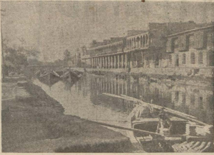
Basradan bir görünüş

Kahire, 18 (A.A.) — Resmen bildirildiğine göre, Dük D'Aosta, Amba - Alagi muntakasındaki İtal- yan kuvvetlerinin teslim olma- sını teklif etmiştir. (Devamı 3 ücül sayfada)